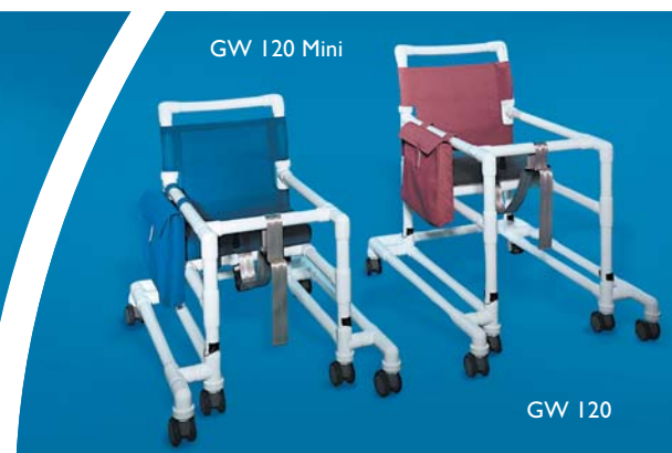
GW 120 Mini