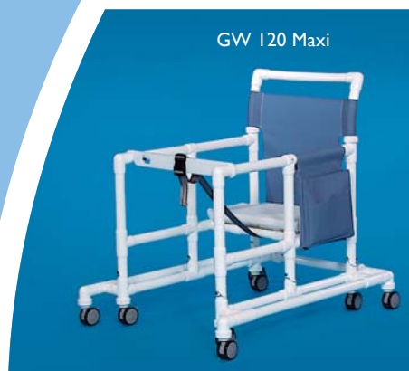
GW 120 Maxi