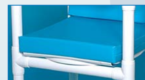
Sitzpolster SPW Sitzplatte mit weichem Polster, wasserdicht in Folie eingeschweißt, mit Ventil, beständig gegen Desinfektionsmittel.