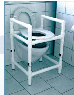
DT 100 HM Die Toilettensitzerhöhung, die gleichzeitig auch Aufstehhilfe, Duschhocker und Nachtstuhl sein kann. Keine Montage, einfach über die Toilette stellen. Mit Höhenverstellung und Spritzschutz. Belastbar bis 150 kg.