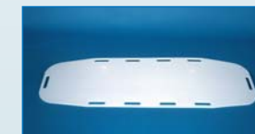
Transfer Board: PTB