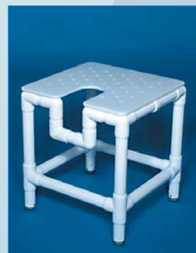
DH 56 Der XL-Duschhocker mit großem Vollkunststoffsitz und Hygieneöffnung, belastbar bis 300 kg.