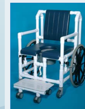
DWH 86 Der Duschwannestuhl für die Duschwanne, der das Platzangebot optimal nutzt und keinerlei Montage erfordert – einfach genial!

Mit dem RCN-typischen Modulsystem lassen sich ganz individuelle Produkte realisieren; extra breite oder extra tiefe Sitzflächen, Polstersitze – zweigeteilt oder mit Hygieneöffnung, Sitzflächen oder Sitzbrille aus Vollkunststoff. Alle Maße, auch Sitzhöhe und Sitzneigung (Sitzkantung), können individuell angepasst werden.