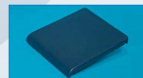
Polstersitz PUS Polstersitz geschlossen, aus PU-Schaum für mehr Sitzkomfort.