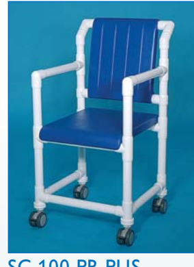
SC 100 PR PUS Der Duschstuhl mit geschlossenem PU-Polstersitz und PU-Polsterrücken.