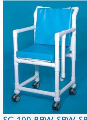
SC 100 RPW SPW SB Der Stuhl mit wasserdichtem Sitz- und Rückenpolster für besonders druckempfindliche Patienten, Farbe nur hellblau.