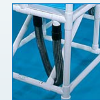
Inklusive Schlauch für kontrollierten Wasserablauf, 90 cm lang, Sonderlängen auf Anfrage.