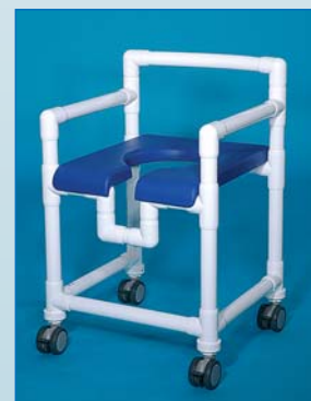
DH 100 PP Modell wie der DH 90 PP mit 4 feststellbaren Rollen, Farbe: kobalt, belastbar bis 150 kg, als XXXL-Version bis 200 kg.