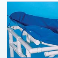
6-fach verstellbares Rücken-/Kopfteil für die bessere Positionierung des Patienten. Option: VR