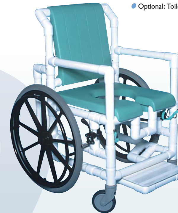
DR 100 PPG