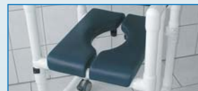
Einfache Verengung der Hygieneöffnung für zierliche Personen.