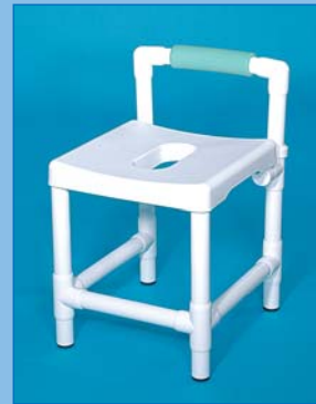
DH 49 RL Der Hocker mit gepolsterter Rückenlehne für mehr Komfort und zusätzliche Sicherheit, Farbe: laguna, bis 150 kg belastbar.