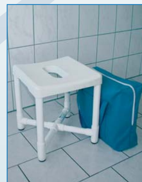
DH 49 R Der Hocker für die Reise, ohne Werkzeug zerleg- und zusammenbaubar, mit praktischer Tasche 43 x 43 x 19 cm, wiegt nur 3,8 kg, belastbar bis 150 kg.