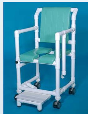
SC 100 PZG SB Der Duschstuhl mit verstellbarem PU-Schaum-Sitz und durchgehender Hygieneöffnung für eine optimale Pflege.