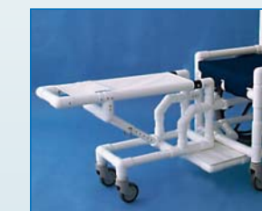
Mitlaufende Beinauflage mit sechsachsigem verstellbarem Neigungswinkel rechts oder links verwendbar. Für alle RCN-Stühle in passender Größe erhältlich: BADR