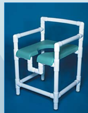
DH 90 PP Der Duschstuhl mit Arm- und Rückenlehne, Polstersitz mit Hygieneöffnung PP, Farbe: laguna, belastbar bis 150 kg.