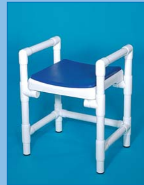
DH 49 A PA Der Hocker mit Armlehnen und Polsterauflage PA, Farbe: kobalt, bis 150 kg belastbar.