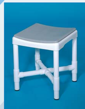
DH 49 PA Der Hocker mit Polsterauflage PA, Farbe: pantone, belastbar bis 200 kg.

Zum Abdecken der Hygieneöffnung dient eine rutschsichere Polsterauflage, erhältlich als Option PA . Farben: pantone, laguna, kobalt und blau.