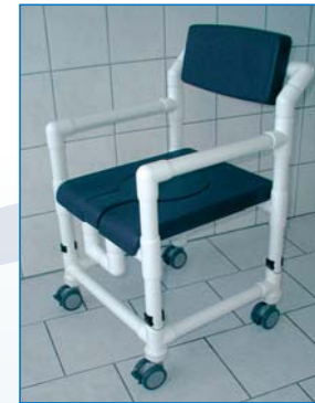
SC 100 PP HV PPE PRS Der Duschstuhl mit Polstersitz PP, Einleger PPE, Höhenverstellung HV und Komfortrücken PRS, Farbe: blau, bis 150 kg belastbar.