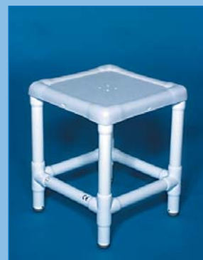
DH 55 Der klassische RCN-Hocker mit abnehmbarem Formsitz, belastbar bis 300 kg.