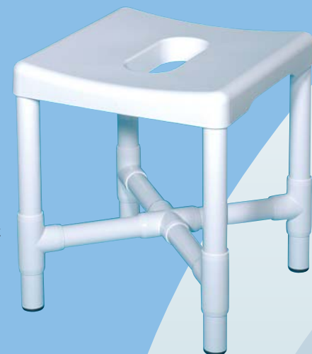
DH 49 Der leichte, dennoch bis 200 kg belastbare Duschhocker, komfortabler Sitz mit zentraler Hygieneöffnung. Praktisch und preiswert.

Zum Abdecken der Hygieneöffnung dient eine rutschsichere Polsterauflage, erhältlich als Option PA . Farben: pantone, laguna, kobalt und blau.