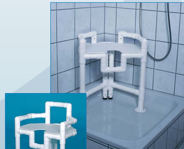
DWH 86 Der Duschwannestuhl für die Duschwanne, der das Platzangebot optimal nutzt und keinerlei Montage erfordert – einfach genial!