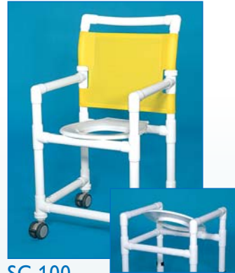
SC 100 Das Grundmodell, Duschstuhl mit hochklappbarer Vollkunststoffbrille und wasserabweisendem Textilene® Gewebe.

Mobile Duschstühle, wendig auf kleinstem Raum durch freidrehende, nicht rostende Doppelrollen - alle mit Feststellbremsen - rückwärts über die Toilette fahrbar, abweichende Sitzhöhen auf Wunsch ohne Mehrkosten.