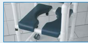
PU-Sitz aus zwei sicher aufliegenden „Halbschalen“. Option: PZ