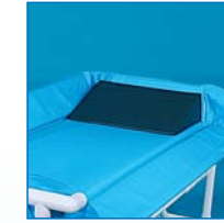
Kopfteil mit wasserdichtem Bezug. Option: DK

Die Einfach-Liege mit durchlässiger Auflagefläche aus strapazierfähigem, nässeunempfindlichem Textilene®-Gewebe. Beidseitig absenkbar Seitenschutzlehnen und Schiebegriffe an Kopf- und Fußende.