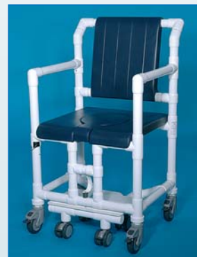
SC 100 OS PPG PPE Der Duschstuhl für bariatrische Patienten, mit PU-Schaum-Sitz und PU-Polsterrücken, belastbar bis 200 kg.