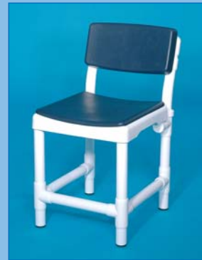
DH 49 PRS PA Der Hocker mit komfortablem Polsterrücken aus PU-Schaum, Farbe: blau, bis 150 kg belastbar.