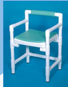
DH 49 A RL PA Der Duschstuhl mit gepolsterter Rückenlehne und Armlehnen, Polsterauflage PA, Farbe: laguna, bis 150 kg belastbar.