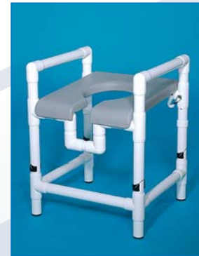
DH 80 PP HV SKV Der Duschhocker mit verstellbarer Sitzkantung für Patienten mit Hüftversteifungen. Belastbar bis 150 kg. Die Option Sitzkantung SKV ist bei vielen Modellen möglich – fragen Sie uns!