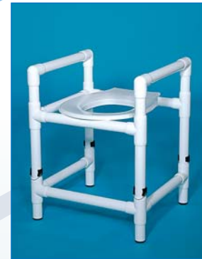
DH 80 HV Der Duschhocker mit hochklappbarer Vollkunststoffsitzbrille, höhenverstellbar, ideal auch als Toilettensitzerhöhung – einfach über die Toilette stellen, kein Montieren, belastbar bis 150 kg.