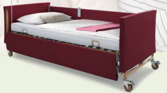
Attraktives Zubehör für Ihr Pflegebett